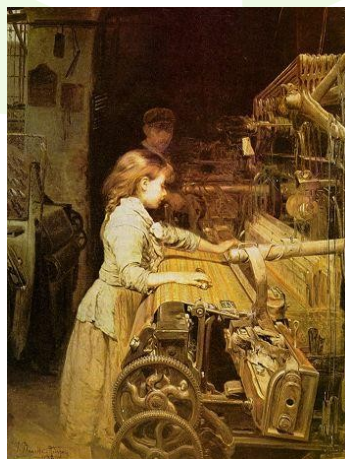
“La Tejedora”, por Joan Planella y Rodríguez (1882).